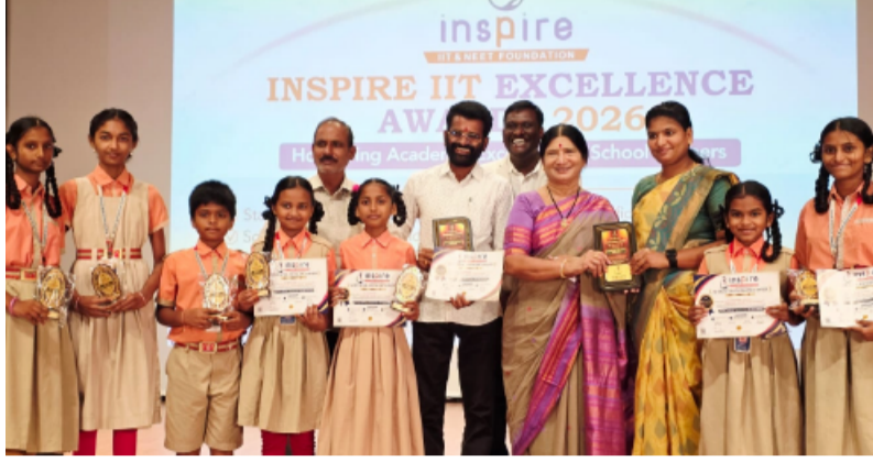
మాట్లాడుతూ...విద్యార్థుల పేర్కొన్నారు. ఇలాంటి Inspire IIT Excellence Awards వంటి కార్యక్రమాలు విద్యార్థుల్లో అభ్యుత్సాహాన్ని పెంపొందించడమే కాకుండా, మరింత మెరుగైన లక్ష్యాలను ఏర్పరుచుకునేలా ప్రేరణనిస్తాయని తెలిపారు. ఈ సందర్భంగా రాష్ట్ర స్థాయి ప్రతిభ కనబరిచిన విద్యార్థులను, పాఠశాల టాపర్లను సత్కరించడం జరిగింది. ఈ కార్యక్రమంలో తల్లిదండ్రులు మరియు విద్యార్థులు పాల్గొన్నారు.