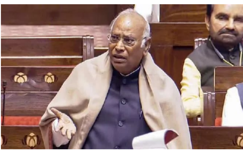
ఆయన గుర్తు చేశారు. పార్లమెంటు ప్రత్యేక సమావేశం ప్రజాస్వామ్యాన్ని పటిష్ఠం చేసేందుకు, అందరినీ ఏకతాటిపై ముందుకు తీసుకు వెళ్లేందుకు ఉద్దేశించినదే అయితే నారీ శక్తి వందన్ అధినయమ్-2023 సవరణతో ముడిపడిన డీలిమిటేషన్లపై చర్చ జరిపేందుకు ఏప్రిల్ 29 తర్వాత అఖిలపక్ష సమావేశం ఏర్పాటు చేయాలని ప్రధానికి రాసిన లేఖలో ఖర్చే సూచించారు.